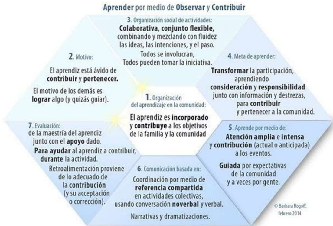
Figura 1. Prisma que representa las facetas del paradigma Aprender por medio de Observar y Acomedirse en labores familiares y comunitarias (LOPI). Tomado de https://learningbyobservingandpitchingin.sites.ucsc.edu/resumen/ .

Por ello, todos pueden tomar la iniciativa. Los niños participan en los quehaceres del hogar porque consideran que es deber de todos colaborar (Coppens, et al., 2014). La comunidad valora que los niños sean acomedidos desde pequeños; es decir, que colaboren con las tareas sin esperar nada a cambio y sin necesidad de pedírselos porque están atentos a las necesidades de otros (López, Najafi, Rogoff, & Mejía-Arauz, 2012).