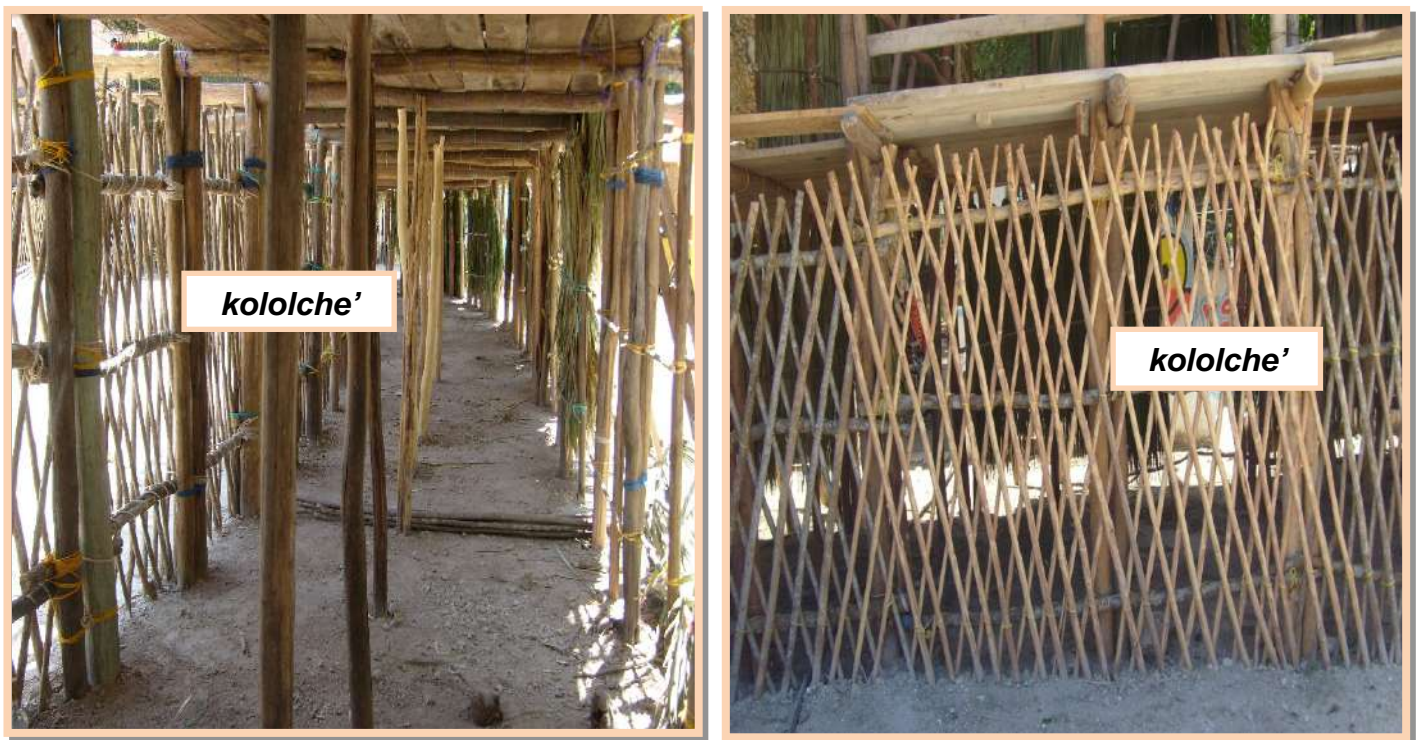
Figura 2. La estructura de las celosías de un palco. A la izquierda se ve el kololche' desde el interior de la planta baja del palco, a la derecha se aprecia desde la parte externa.

El juez de plaza decide si debe recibir el koloxche 25 , que le dicen, para poner, como hay esa corrida de postín, que esos toros que son de lidia, porque cuando meten los toros de la región, no es tanto, que diga, no es peligro porque están andando aquí ponen la capa, entran para la lidia. Cuando salen los toros del lunes, los toros, esos sí son toros de casta, es donde está el peligro, porque ellos vienen con fuerza y chocan con las maderas, pos así de años anteriores, atrás, la gente está ahí abajo, un accidente puede ocurrir 26 .